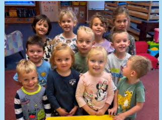
Zprávy z MŠ