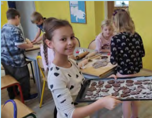
Zprávy ze ZŠ

Přejeme Vám veselé Vánoce a šťastný nový rok 2026.